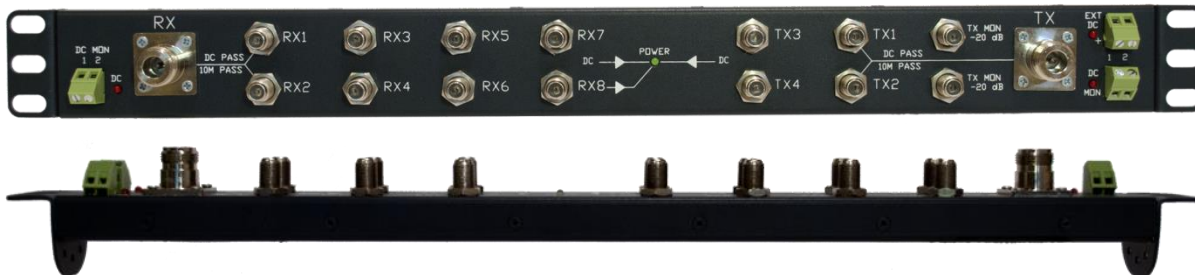
Рисунок 1 Внешний вид UHP-IFS

UHP-IFS имеет маркировку с указанием уникального серийного номера изделия на задней части корпуса изделия и на боковой стороне упаковки изделия.